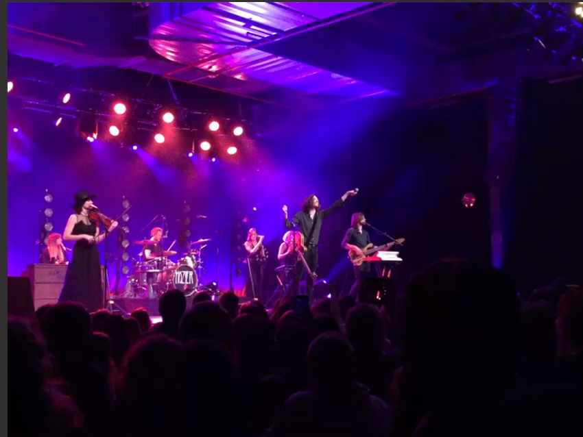
Carlswerk Victoria, Konzertveranstaltung