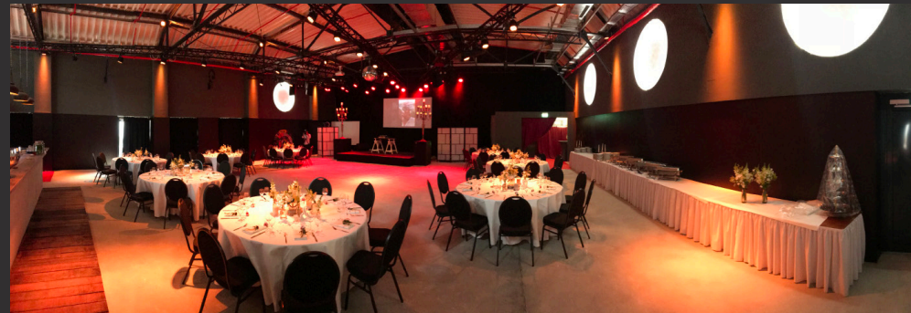
Club Volta / Bankettbestellung und Buffet