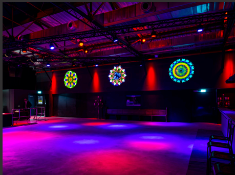
Club Volta / Aufbau Konzertveranstaltung