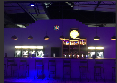
Club Volta / Ansicht Thekenbereich