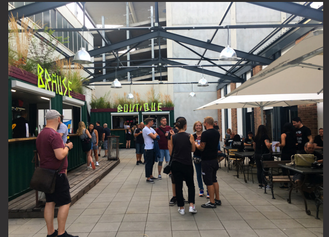
Außenbereich / Biergarten