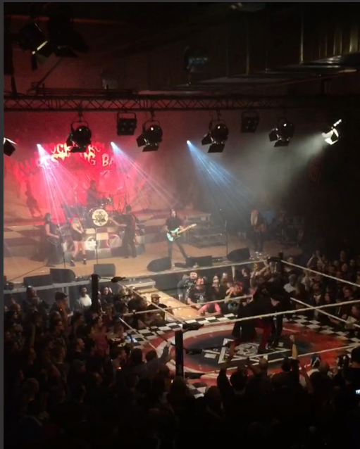
Carlswerk Victoria, Konzertveranstaltung