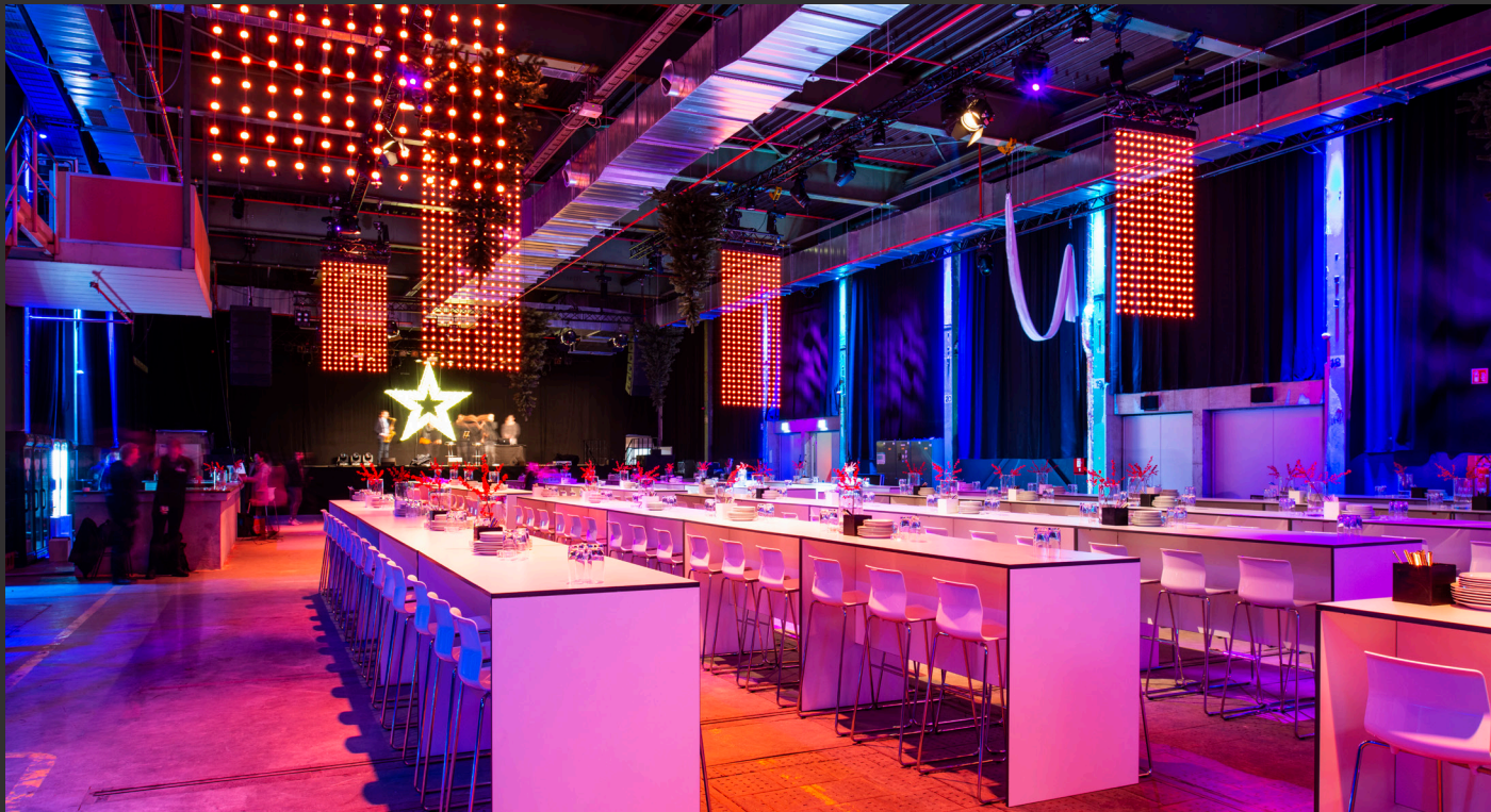
Carlswerk Victoria / Gala-Veranstaltung