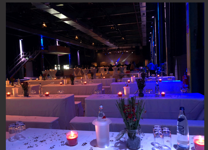
Carlswerk Victoria, Gala-Veranstaltung