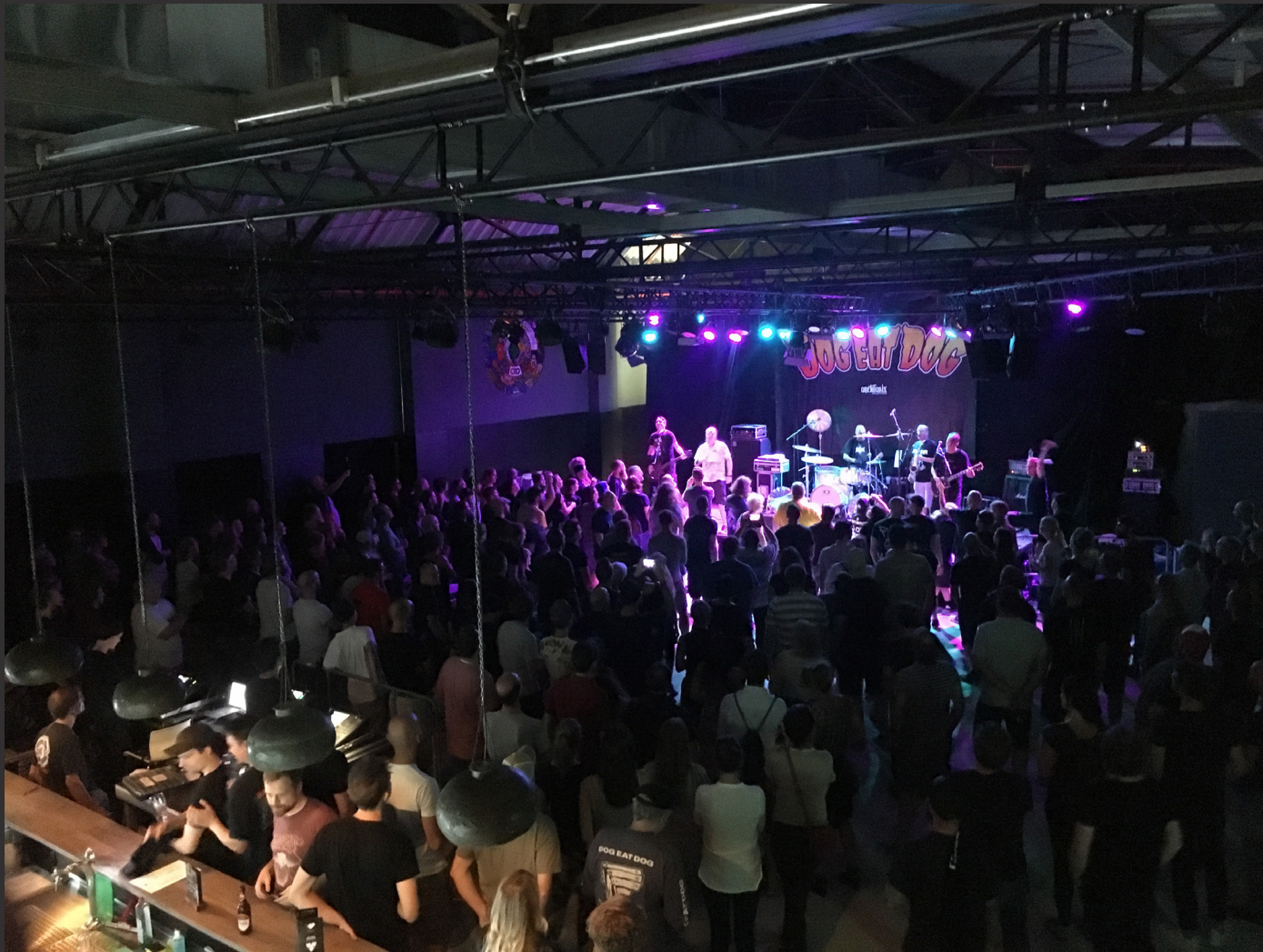
Club Volta / Konzertveranstaltung