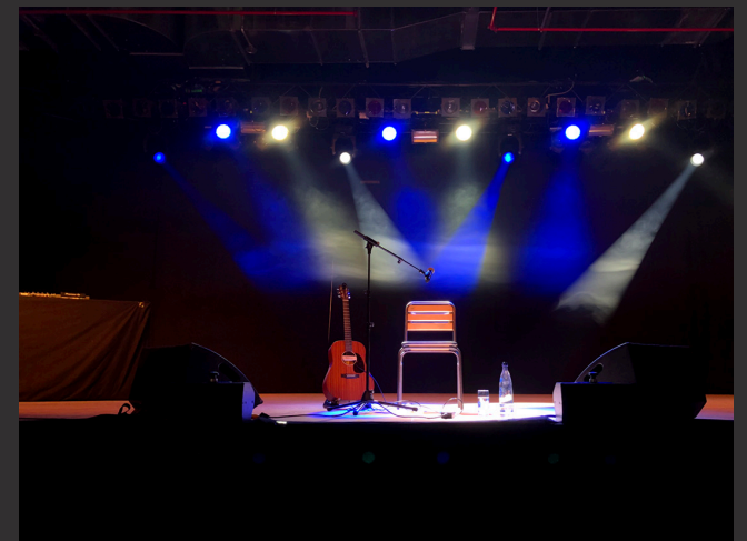
Club Volta / Bühne