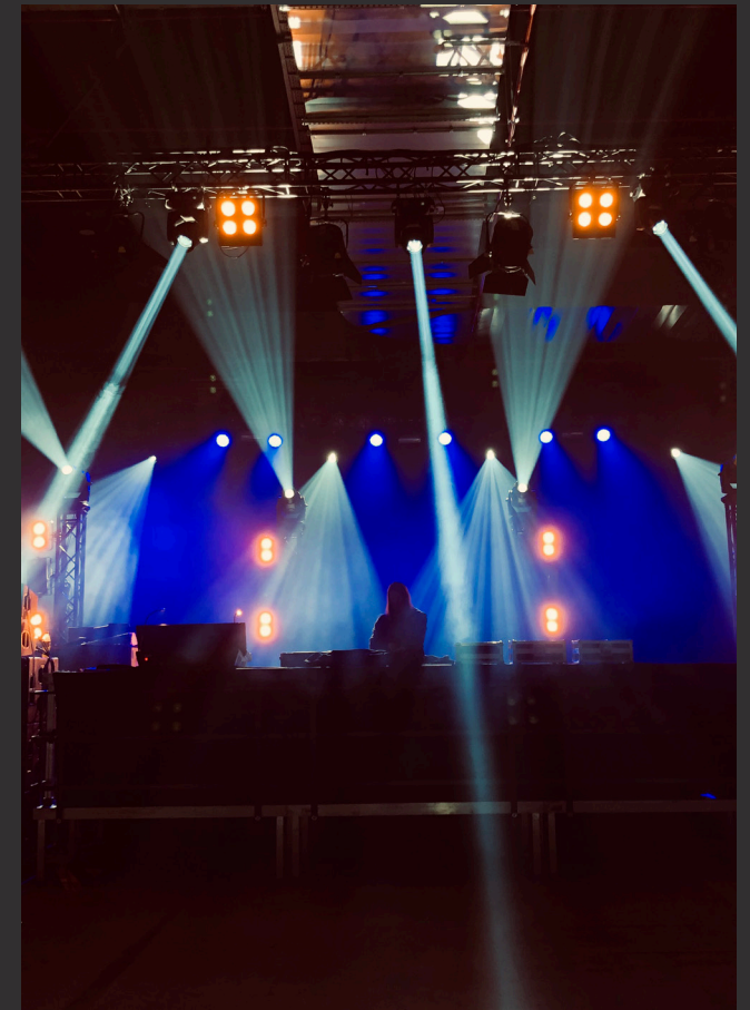
Carlswerk Victoria, Aufbau DJ-Set, Partyveranstaltung